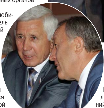
Конструктивное сотрудничество обеих ветвей власти - на благо региона.