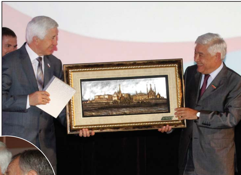
«Саратовских депутатов поздравили коллеги – руководители заксобраний других регионов ПФО».

В целом деятельность Саратовской областной Думы выстраивается в соответствии с задачами федерального и регионального законодательства, и в первую очередь в рамках планов развития нормативной базы, обеспечивающей правовое регулирование проводимых в стране реформ. Приоритетным направле-